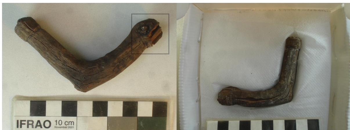
Figura 3. Estado de la tarabita luego de las extracciones de las muestras (el recuadro indica el área intervenida) y condiciones actuales de almacenaje del objeto.

y hasta 10 células de altura, vasos de trayecto rectilíneo; c) corte longitudinal radial: radios homocelulares compuestos por células procumbentes, presencia de cristales de oxalato. Se determinó afinidad taxonómica con el género Larrea sp. Cav. Zygophyllaceae, arbusto nativo que crece entre los 0-3000 msnm y se encuentra en diversas provincias de Argentina, incluida Catamarca (Zuloaga y Morrone 1997/2008). Cabe aclarar que la extracción de las muestras implicó una intervención muy limitada del objeto, sin afectar significativamente otras características de este como por ejemplo sus dimensiones principales (Figura 3) 3 .