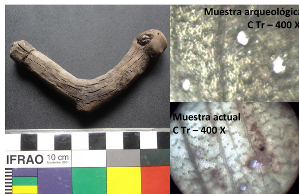
Figura 1. Tarabita relevada en La Alumbreira y cortes transversales en muestras arqueológica y de referencia.

Las tarabitas consideradas por estos investigadores provienen de sitios arqueológicos de la Puna y su borde (quebradas de Humahuaca, del Toro y Las Cuevas, valle Calchaquí y valles mesotérmicos meridionales del Cajón y Hualfín). Entre ellas predominan las elaboradas en madera, mientras que sólo algunas fueron manufacturadas sobre hueso. La identificación botánica de la madera de los ejemplares de las colecciones del Museo de La Plata indicó el uso predominante de recursos locales, con algunas excepciones. Entre ellas, una de las tarabitas procedentes de Antofagasta de la Sierra, manufacturada en leño de jarilla ( Larrea sp.), planta no disponible en esa región de Puna. Cabe mencionar que entre las horquetas analizadas por Raviña et al. (2007) sólo otras dos, relevadas en Puerta de Corral Quemado (valle de Hualfín, Provincia de Catamarca), fueron elaboradas en esa madera.