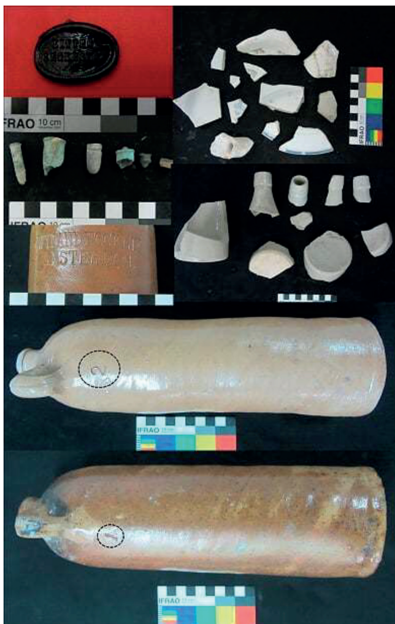
Figura 4. Materiales recuperados en la casa del intendente Rómulo Franco en la isla de Puan. Arriba derecha: loza y porcelana. Arriba izquierda: sello de botella de vidrio “Bitter Secretast”. Centro izquierda: proyectiles. Centro derecha: fragmentos de botellas de gres. Abajo: botellas de gres de ginebra “Wynand Fockink”.

En total se recuperaron 67 elementos sobre el terreno, actualmente depositados en la sala de interpretación de la isla, entre los cuales deben mencionarse la base de una botella de vidrio verde gruesa; un fragmento de asa similar a las botellas de gres mencionadas previamente; 11 fragmentos de base, cuello y cuerpo de pequeñas botellas de gres color blanco mate, 14 fragmentos de loza