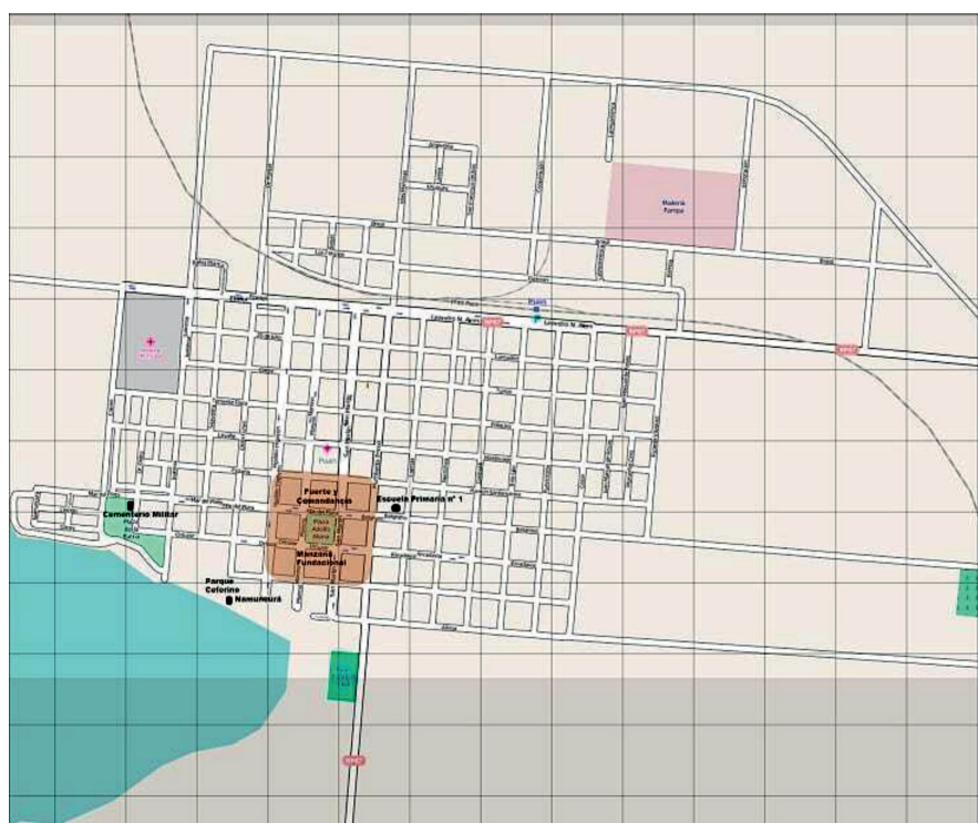
Figura 2.a) Mapa del sector NE del partido de Puan, con los sitios considerados en este trabajo. b) Plano de la localidad de Puan con los sitios ubicados en zona urbana.