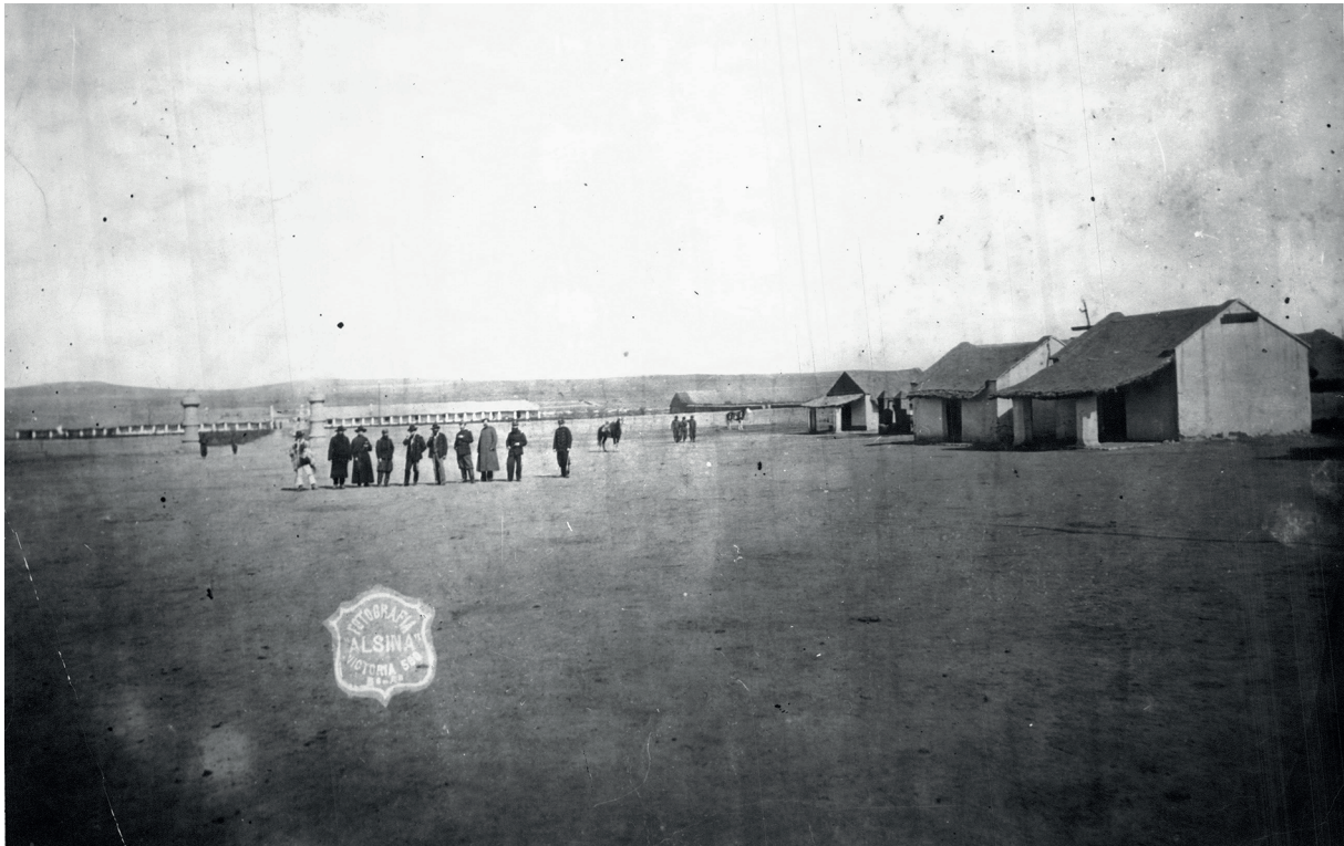
Figura 1. Cacique Manuel Pichi-huinca (el primero a la izquierda) junto con los sacerdotes Espinosa y Costamagna, y los militares Cnel. García, Gral. Roca, Tte. Cnel. Olascoaga, Cnel. Villegas, Cnel. Wintter, Cnel Pico y Tte. Cnel. Cerri en la Plaza y Comandancia de Puan. Fotografía tomada por Antonio Pozzo en abril de 1879. Argentina Archivo General de la Nación.

circundan, además del lugar conocido como Plaza de la Patria, donde se supone estuvo emplazado el Cementerio Militar; y la casa del primer intendente de la localidad ubicada en la isla. Los sitios restantes correspondientes a fortines y a la colonia Santa Rosa se emplazan en campos de propiedad privada (Figura 2a). Ambos tipos de locaciones